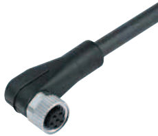
Abbildung / Figure

Winkeldose, umspritzt, Schraubversion, M8 x 1, Edelstahl-Gewindeverriegelung Female angled connector, moulded, screw version, M8 x 1, stainless steel locking ring